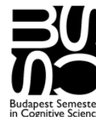
Budapest Semester in Cognitive Science

Az eddigi konferenciakötetek az Akadémiai Kiadónál, a Typotex-nél és az Osiris Kiadónál, valamint a Magyar Pszichológiai Szemle különszámaként jelentek meg.